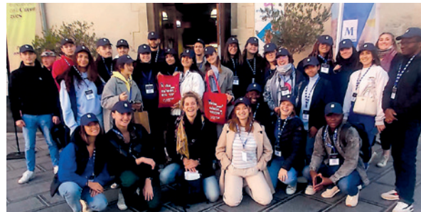
Les étudiants de Keyce Academy, prêts à accueillir les visiteurs de Cœur de Ville en Lumières

« Être partenaire d'un événement comme Cœur de ville en Lumières est l'exemple même de la volonté de Keyce Academy de s'ancre dans la vie culturelle et économique locale.