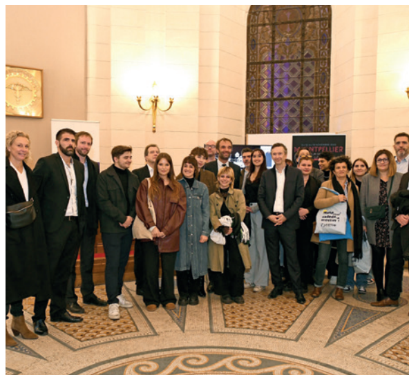
Lors de la soirée des Mécènes et Partenaires de Coeur de Ville en Lumières 2023.