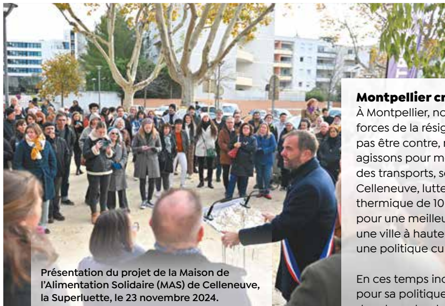
Présentation du projet de la Maison de l'Alimentation Solidaire (MAS) de Celleneuve, la Superluette, le 23 novembre 2024.