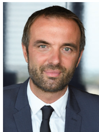
Michaël DELAFOSSE Maire de Montpellier Président de Montpellier Méditerranée Métropole

Demain pour l'écologie, pour le pouvoir d'achat, d'autres villes suivront l'exemple de Montpellier.