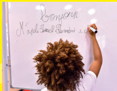
École Marie de Sévigné

Selon l'article L. 312-10 de la loi sur la refondation de l'école du 8 juillet 2013.