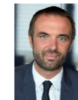
Michaël Delafosse Maire de Montpellier Président de Montpellier Méditerranée Métropole

rencontres ont permis d'alimenter le projet initial et à le faire évoluer. Ces changements ont été le fruit d'une collaboration étroite avec les habitants et les habitantes, car nous croyons que la réussite d'un projet de renouvellement urbain repose sur la participation de chacun et chacune. C'est pour cela que nous viendrons vous présenter et échanger avec vous sur les évolutions du projet du quartier des Cévennes lors d'une réunion publique qui aura lieu le 9 mars 2024 à 10h30 au collège Simone Veil. Venez aussi retrouver nos équipes au sein de la Maison du projet des Cévennes au 509, rue Paul Rimbaud.