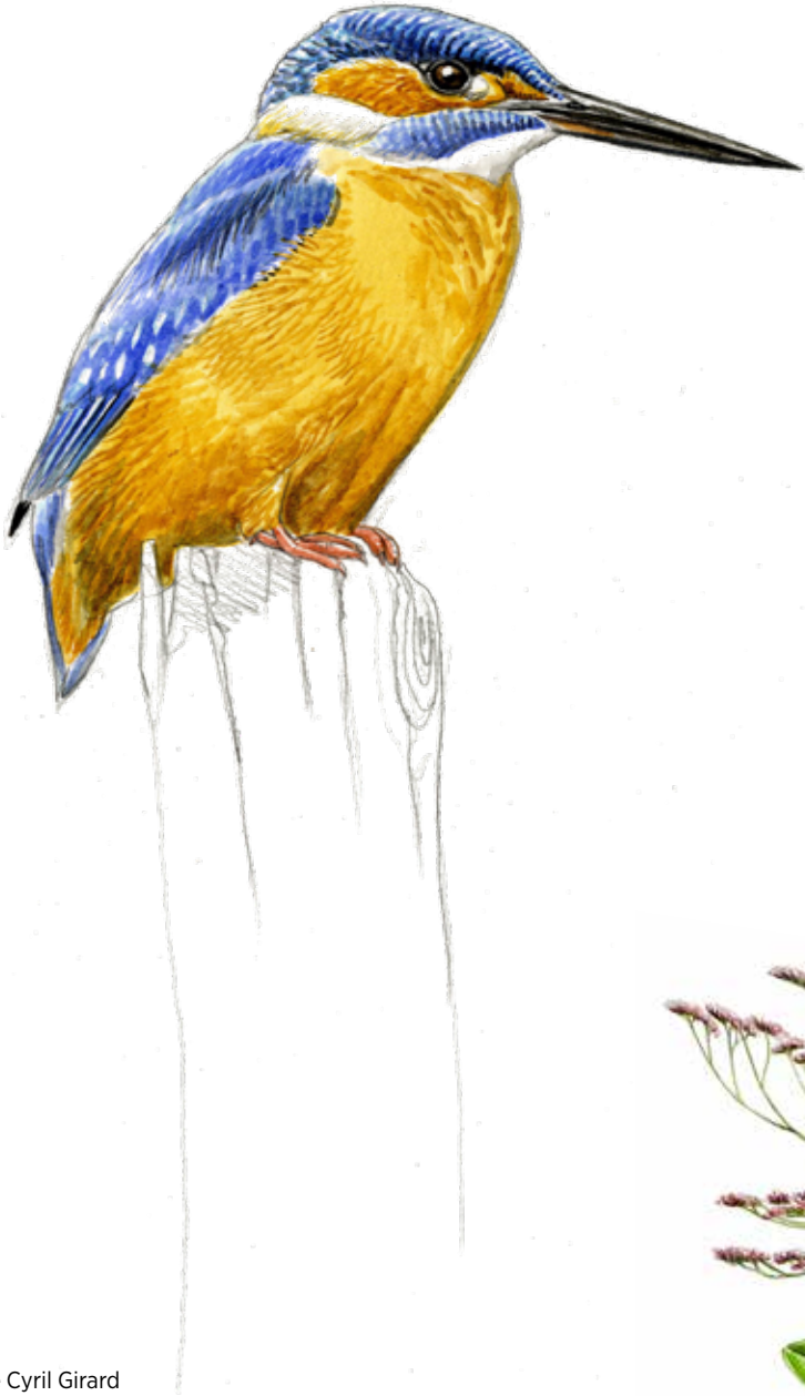
Illustrations de Cyril Girard